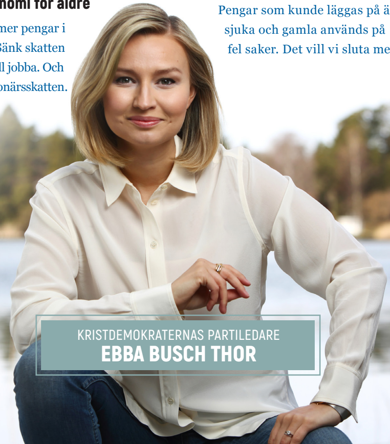
KRISTDEMOKRATERNAS PARTILEDARE EBBA BUSCH THOR

Pengar som kunde läggas på äldre, sjuka och gamla används på fel saker. Det vill vi sluta med.