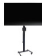
Plasmaskärm inkl golvstativ ArtNr. 46 048