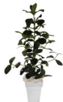
Ficus ca 120 cm ArtNr. 10 186