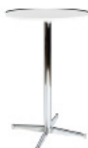
Bord VM, ståbord h 110 cm, Ø 70 cm ArtNr. 10 787