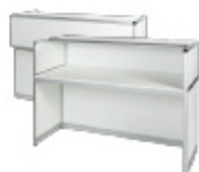
Disk Info Tech b 150 cm, d 60 cm, h 104 cm ArtNr. 10 805

Beställ enkelt och smidigt möbler och artiklar till ditt mässhdeltagande.