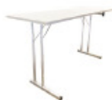
Bord 140x50 cm ArtNr. 46 010